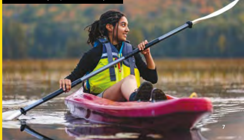
Lac de L'Assomption, secteur L'Assomption

Pour plus d'information, consultez notre site Web à sepaq.com/securite