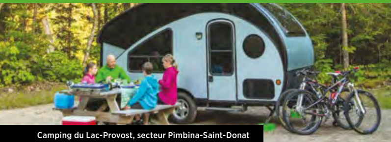
Camping du Lac-Provost, secteur Pimbina-Saint-Donat