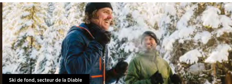
Ski de fond, secteur de la Diable

L'impressionnant réseau de sentiers du parc vous permet d'être aux premières loges pour assister au puissant spectacle des couleurs à l'automne. Quatre d'entre eux mènent à des belvédères aux panoramas exceptionnels : La Roche et la Corniche (secteur de la Diable), l'Envol (secteur Pimbina-Saint-Donat) et les Grandes-Vallées (secteur de L'Assomption). D'autres encore se rendent à des refuges accessibles de jour. Parfait pour y prendre une pause ou une collation ! Consultez le tableau des sentiers à la page 3 pour plus de détails.