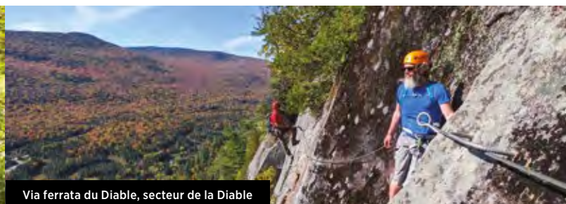
Via ferrata du Diable, secteur de la Diable

Venez vous émerveiller devant les quatre grandes chutes du parc, toutes uniques : la chute du Diable et les chutes Croches (secteur de la Diable), situées sur des parcours de randonnées pédestres accessibles et menant à des belvédères d'observation; la chute aux Rats (secteur Pimbina-Saint-Donat), haute de plus de 17 m et comportant une aire de pique-nique et une halte, ainsi que la chute aux Mûres (secteur de la Cachée), avec sa charmante petite passerelle de bois.