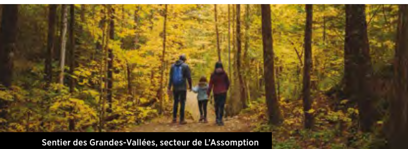
Sentier des Grandes-Vallées, secteur de L'Assomption

Dans un parcours longeant la paroi rocheuse de la montagne de la Vache Noire où se succèdent paysages à couper le souffle, ponts de singe, passerelles et cascades, venez étancher votre soif de liberté sur ces hauteurs impressionnantes du parc. Un guide professionnel vous accompagnera lors de cette ascension à plus de 200 mètres d'altitude où règnent des paysages de grande beauté. Frissons garantis ! Consultez les détails à la page 6.