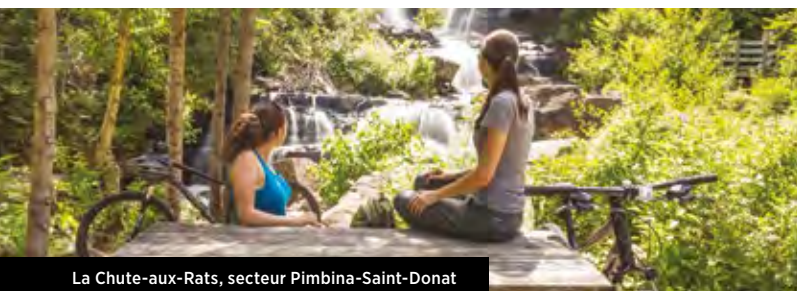
La Chute-aux-Rats, secteur Pimbina-Saint-Donat

À l'aide de puissants télescopes, lancez-vous à la recherche de corps célestes tout en approfondissant vos connaissances sur l'astronomie. Consultez la grille horaire des activités de découverte pour plus de détails.