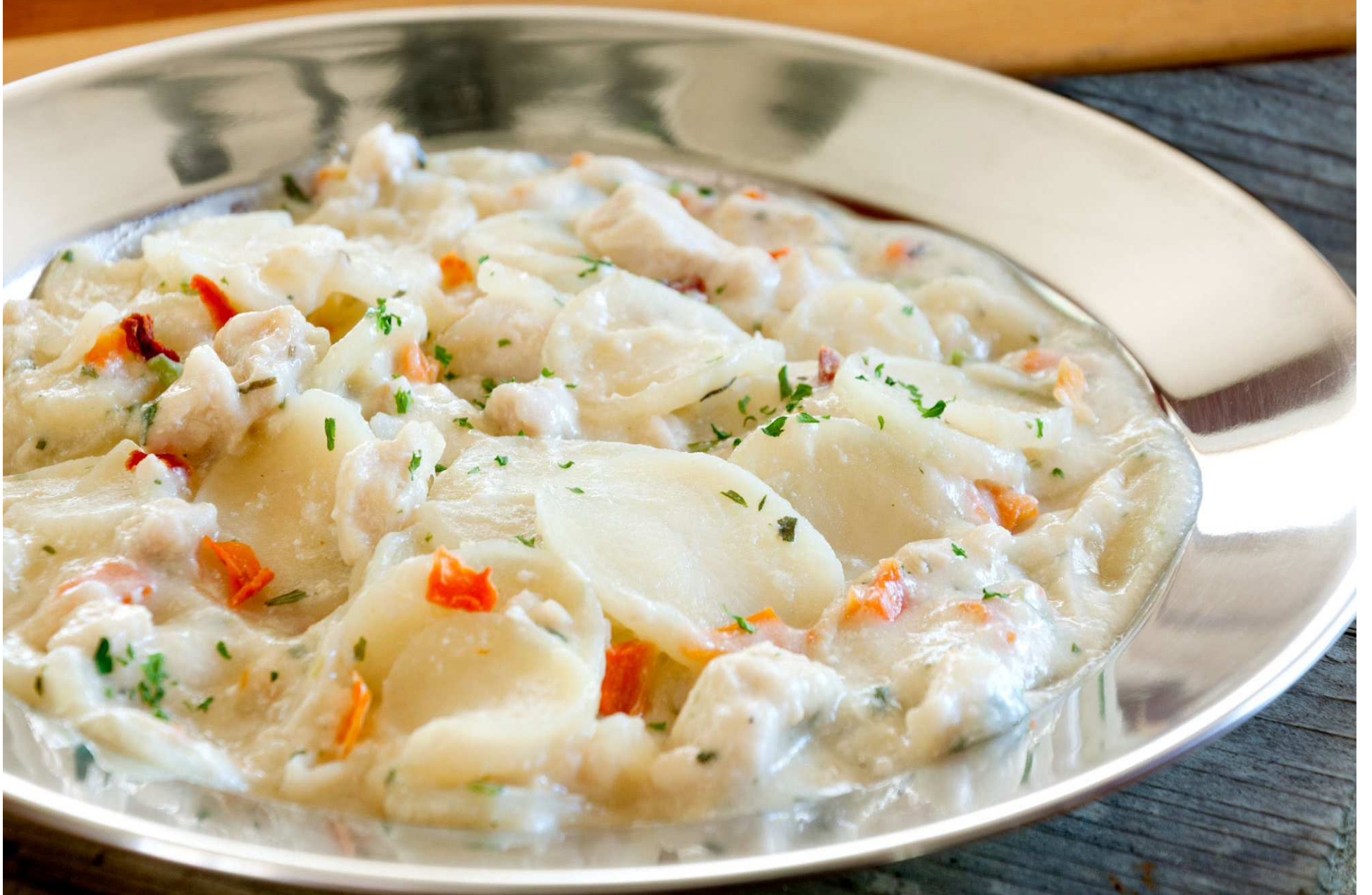
Dauphinoise de poulet à l'estragon