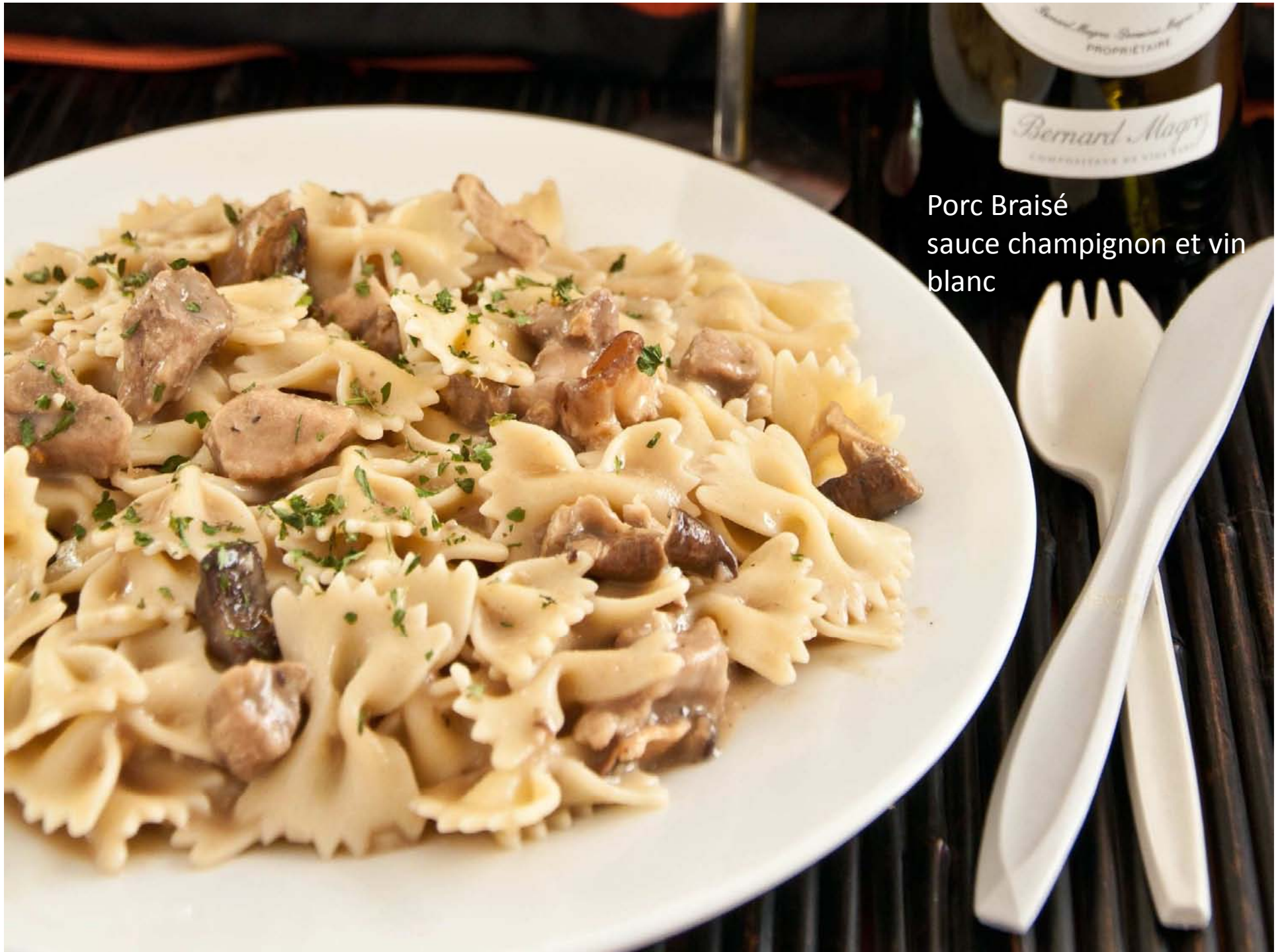
Porc Braisé sauce champignon et vin blanc