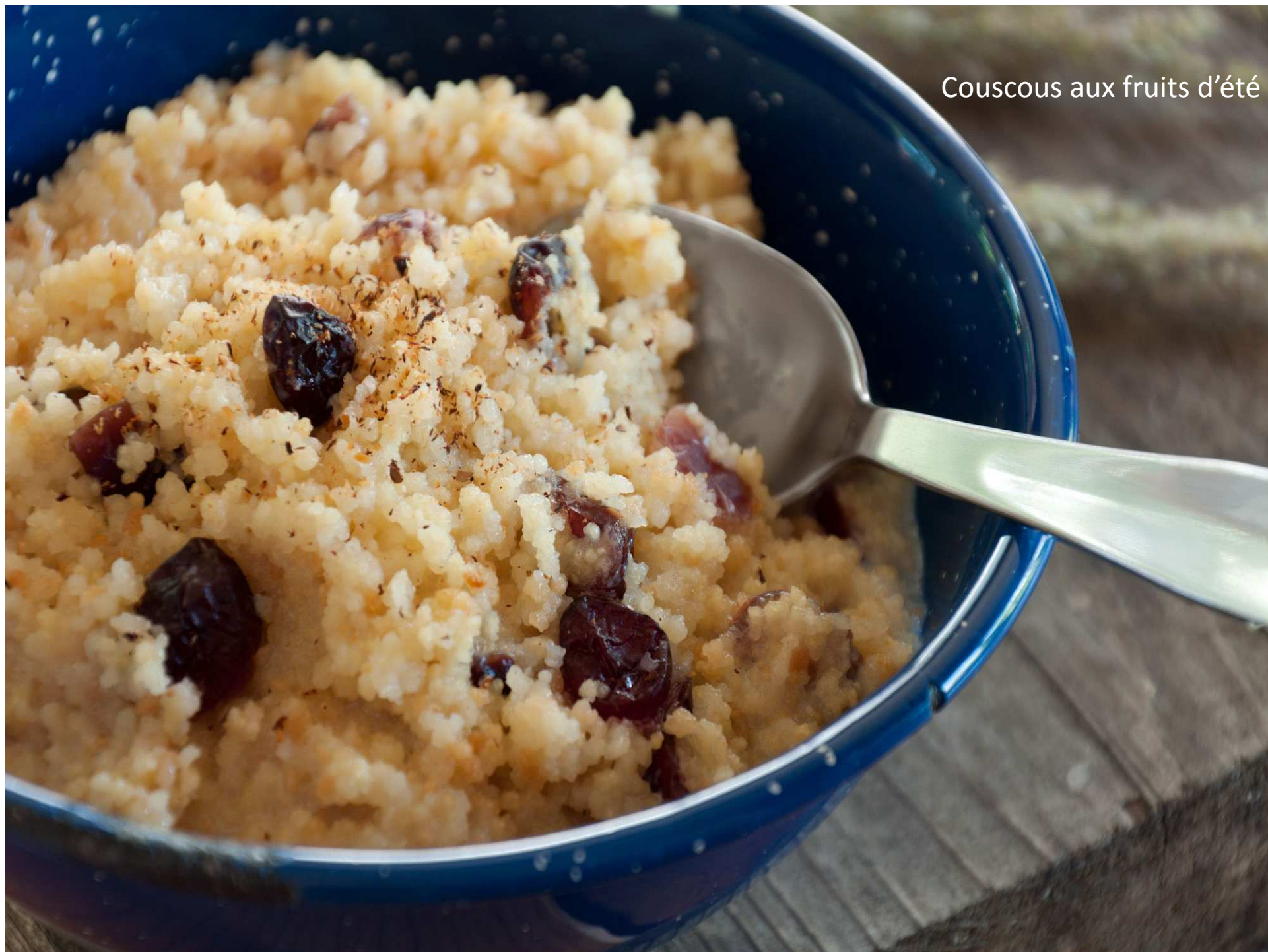
Couscous aux fruits d'été